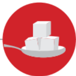
DIETA RICA EM AÇUCARES

As doenças orais partilham muitos dos fatores de risco de outras doenças. Alguns como a idade, sexo, hereditariedade são fatores de risco conhecidos como não modificáveis. Os fatores de risco relacionados com os hábitos, comportamentos e estilos de vida, são considerados modificáveis e incluem: