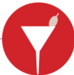
CONSUMO DE ÁLCOOL EM EXCESSO