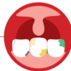
HIGIENE ORAL DEFICITÁRIA