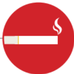
CONSUMO DE TABACO