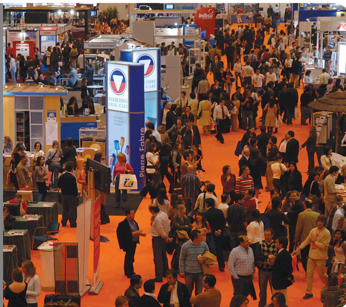
Astra Tech Dental foi a empresa vencedora do prémio para o melhor stand da Expo-Dentária, atribuído pelo público presente.