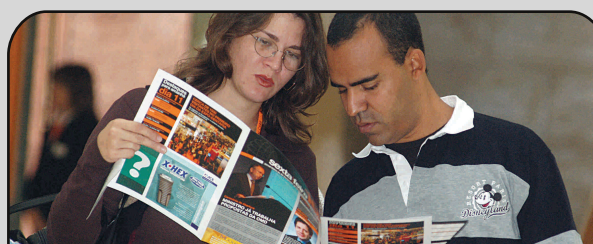
Jornal Diário do Congresso - Voltou a ser vedeta, ocupando um lugar que os Médicos Dentistas já não dispensam.