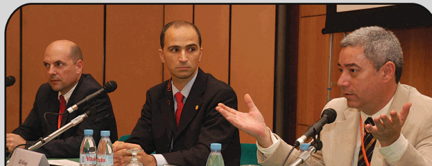
Fórum Multidisciplinar de Controvérsias - Excedeu todas as expectativas e, à semelhança da Sessão Clínica de Tratamento, despertou grande interesse e discussão entre os presentes.