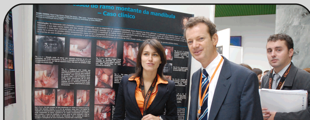
Apresentações de Poster - O congresso foi marcado, uma vez mais, pelo elevado número e qualidade dos posteres apresentados.