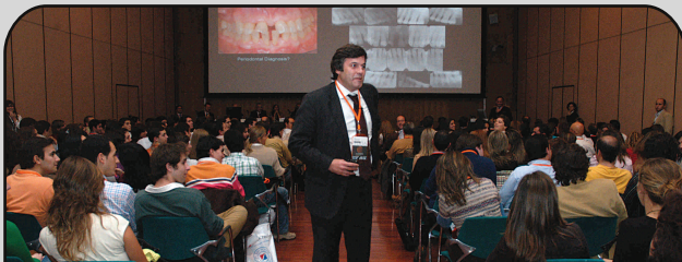
Sessão Clínica Plano de Tratamento - Pela primeira vez adoptamos este tipo de formato que monopolizou a atenção de centenas de colegas, gerando grande interação dos intervenientes com a plateia.