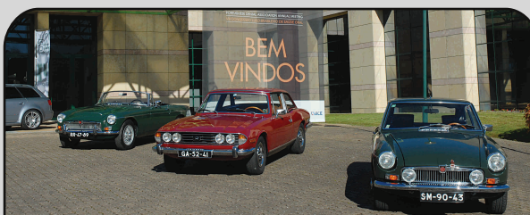
Dez máquinas de gabarito - Transportaram os congressistas às maravilhas de um passado não muito distante.