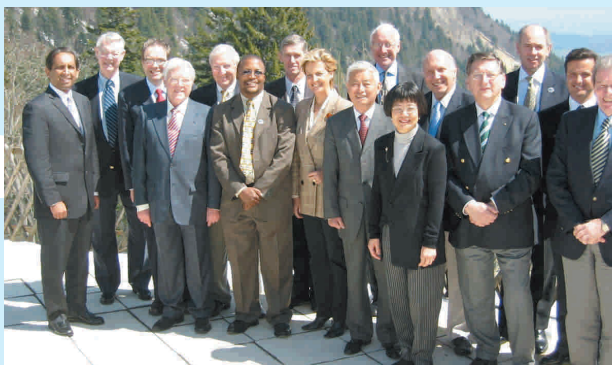
Council da FDI reuniu em Genebra

A revisão de outras propostas estava também incluída na agenda, mas não foram aprovadas e serão referidas novamente às