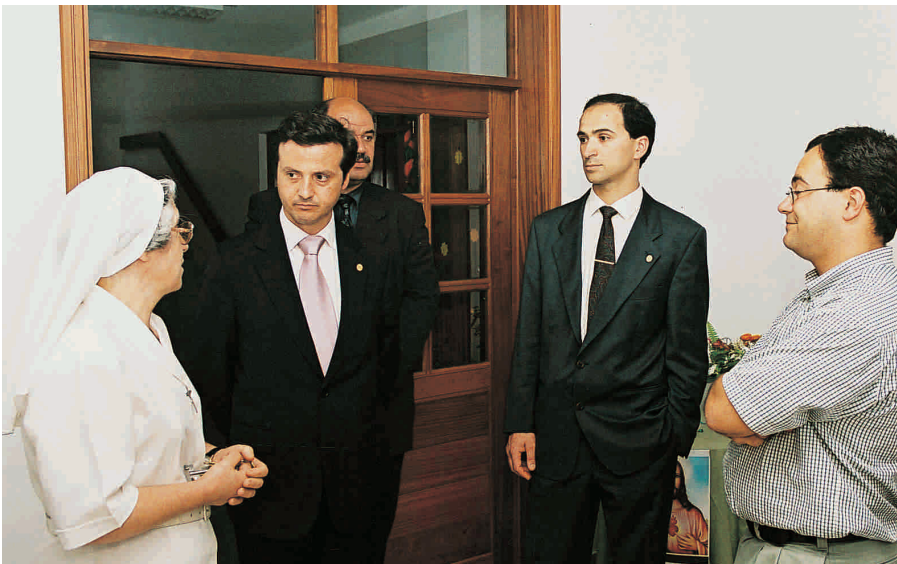
Casa de Saúde Câmara Pestana

O encontro com os colegas que exercem na RAM, reuniu cerca de 30 profissionais, com o objectivo de ouvirem por parte dos responsáveis da OMD algumas respostas a temas que os preocupam, assim como, de se colocarem questões, trocar experiências e partilhar ideias quanto ao estado da Saúde Oral na Região, em particular, e da Medicina Dentária em geral.