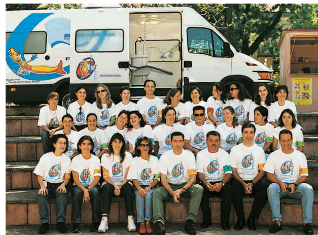
Equipa de Prevenção de Saúde Oral da RAM