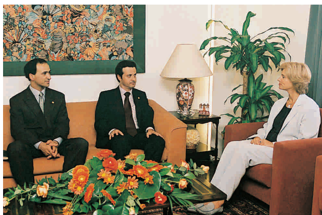
Audiência com a Secretária Regional dos Assuntos Sociais

No âmbito do Programa de Promoção de Saúde Oral da Região Autónoma da Madeira (RAM), decorreu de 20 a 22 de Junho, no Jardim Municipal da cidade do Funchal, a IV edição da “Semana Sorridente”, iniciativa da responsabilidade do Grupo de Prevenção em Saúde Oral, em colaboração com o Centro Regional de Saúde da Madeira, cujo objectivo primordial é sensibilizar a população em geral, e as crianças em particular para a promoção e prevenção de cuidados básicos de Saúde Oral.