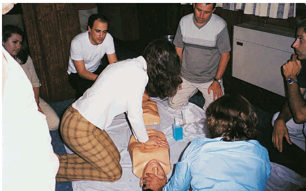
Lisboa ( Hotel Mundial )