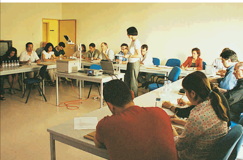
Covilhã ( Hospital da Cova da Beira )

A decisão de incluir um almoço de trabalho na inscrição do curso parece ter sido uma aposta ganha, uma vez que permite que se estabeleça um convívio salutar entre colegas, também este um objectivo do Programa de Formação Contínua da OMD.