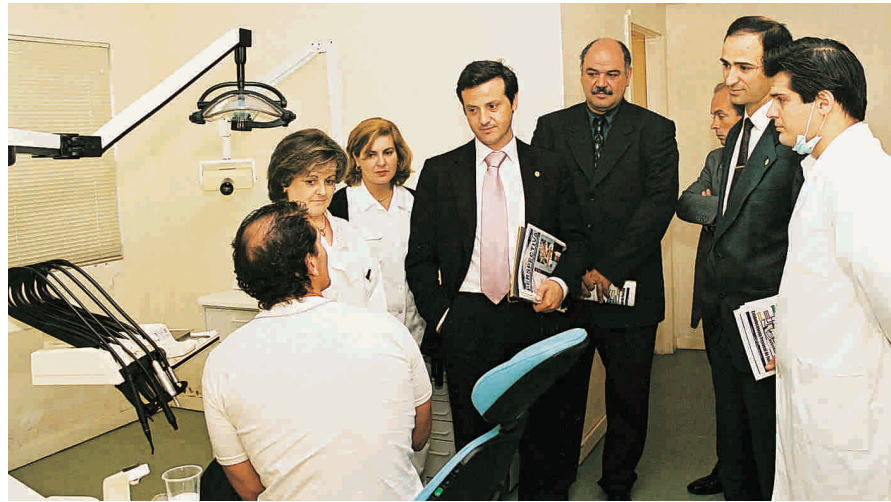
Estabelecimento Prisional do Funchal.

Para além da participação nas iniciativas da “Semana Sorridente”, esta deslocação foi igualmente uma oportunidade para estabelecer contactos com diversas entidades, designadamente uma audiência com a Secretária Regional dos Assuntos Sociais, bem como, visitas a organismos de diferentes âmbitos de actuação, como estabelecimentos prisionais e instituições onde existem instalações para a prática da Medicina Dentária e nos quais está a ser desenvolvido um trabalho muito positivo.