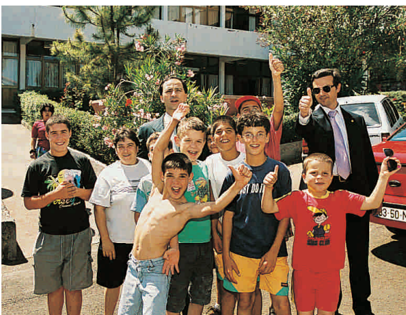
Centro de Reabilitação Psico-Pedagógica da Sagrada Família